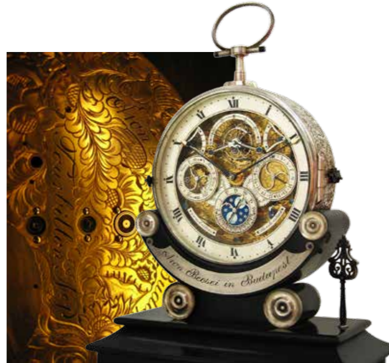
陀飞轮1号座钟上拥有华美富丽的手工雕刻纹饰

另外，在 Aaron 身上还有非常有趣的一点，与他是匈牙利人有关。事实上，匈牙利这个国家单从地理位置上看，正好处于欧洲大陆的中部。恰巧 Aaron 和他的妻子都表达出其作品实际上是