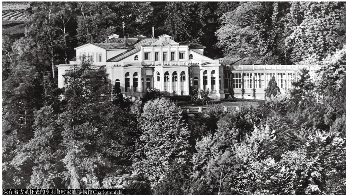
保存着古董怀表的亨利慕时家族博物馆 Charlottenfels

在这期间，腕表品牌亨利慕时和俄罗斯的国家环境紧紧相连。一些时计作品可以作为历史的见证，直接讲述着曾经的人物和事件。这只盘面上印有沙皇亚历山大二世肖像的怀表属于一位俄罗斯世袭贵族——Vladimir Lazo (1855-1937 年)。亚历山大二世在沙俄帝国和奥斯曼土耳其帝国战争之际，访问在巴尔干地区前线 (1877-1878 年) 期间，将怀表奖励给时任莱布卫队 Litovskii 波尔克 (一个沙皇俄国很特殊的沙皇军团) 中尉的 Vladimir Lazo。他于 1877 年 11 月 28 日巧用策略在保加利亚小镇 Sakharnaya