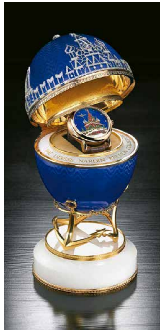
圣巴素大教堂珐琅彩绘腕表

另一款“萨丹进击号”腕表则承载着与俄罗斯历史军事相关的内容。“萨丹进击号”(Shtandart) 是波罗的海舰队第一艘驱逐舰。1703年，彼得大帝和亚历山大列夫总督下令建造这艘军舰，由一名荷兰造船家负责监督，在奥洛涅茨附近的Olonetsky造船厂制成。“萨丹进击号”是为开通由俄罗斯到波罗的海的全新贸易航道而打造，在1917年10月俄国革命之前都隶属于俄罗斯帝国海军舰队。为表达对昔日帝国海军的敬意，雅典设计出与军舰同名的珐琅彩绘腕表，并且以彩蛋元素呈现。表盘以丝珐琅彩绘技术手工勾勒出首都圣彼得堡的地标建筑，如圣艾萨克大教堂和海军总部。腕表同样由华丽贵气的沙皇蛋壳雕展示，蛋壳外层采用多层次、白色、半透明搪瓷珐琅制作，并以4.25克拉钻石镶嵌。由此雕琢而成的圣彼得堡海军总部具有古典风格的尖顶、圆柱与拱门，同时参谋总部大楼和著名的开合式吊桥也在其中，并且刻画吊桥在夜间打开提供大型舰船航行通道的场景，还原了生动而丰富的首都风貌。