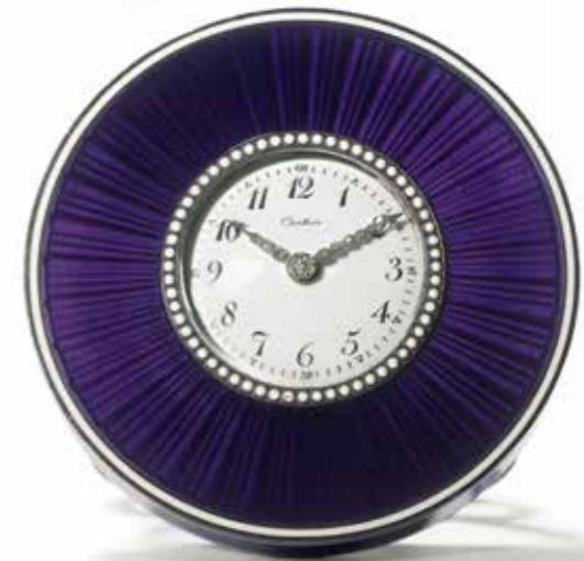
1907年俄罗斯风格项链钟