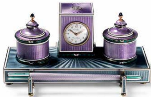
卡地亚俄罗斯风格座钟

东欧，从地理上划分多半是指奥地利、意大利以东的欧洲，但是缺乏明确的定义和边界。按照自然地理划分，俄罗斯的欧洲部分，以及前苏联解体独立的国家如乌克兰等。按照人文地理划分，东欧指二战结束后、冷战期间的社会主义阵营各国，现今都转变成成为资本主义国家。横跨亚欧大陆的俄罗斯是人们最为熟悉的东欧国家。它以自己独特的历史和文化沉淀，在艺术和文学方面对世界产生重要影响，孕育多位名家。他们以优秀的作品成为人类历史上耀眼的瑰宝巨匠，成就覆盖建筑、绘画、雕塑、音乐和电影等领域。普希金、托尔斯泰、《伏尔加河上的纤夫》、《钢铁是怎样炼成的》、《这里的黎明静悄悄》……这些为世界人民耳熟能详的大家及作品象征着这个国家是一片滋生创作灵感的沃土。因此，在这里讨论东欧风情先以俄罗斯为代表来谈一谈。