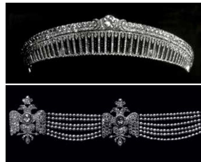
1911年，罗曼诺夫家族的尤苏帕夫王子购买了一顶卡地亚地冠冕；1900年弗拉迪米尔大公夫人向卡地亚定制的狗项圈；

1904年至1905年间，皮埃尔·卡地亚 (Pierre Cartier) 出访俄国。贵族们不断尝试说服卡地亚在当地设立一家珠宝店，其中最主要的游说者便是梅克伦堡·什未林公国 (Mecklenburg-Schwerin) 的公主，即亚历山大二世之子弗拉迪米尔大公 (Grand Duke Vladimir) 夫人——玛莉亚·帕弗洛娜。1900年之后，她向卡地亚定制了一条狗项圈，由六排珍珠组成，点缀着两只镶钻白肩鹞图样。1907年，沙皇亚历山大三世 (Tsar Alexander III) 遗孀玛丽亚·费多罗芙娜太后 (the Dowager Empress Maria Feodorovna) 来到位于巴黎和平街13号的卡地亚精品店，由路易·卡地亚 (Louis Cartier) 为她展示了华美的作品。玛丽亚皇太后希望卡地亚在圣彼得堡建立分店。随后，在当年圣诞节，卡地亚于涅瓦河畔圣彼得堡欧洲大酒店内，举行了一次临时展览。玛丽亚·费多罗芙娜、欧嘉帕雷公主 (Princess Olga Paley) 等俄国皇室贵族成员对于展出的冠冕、胸针配饰倾心而着迷。1911年，罗曼诺夫家族的尤苏帕夫王子 (Princess Yussupov) 购买了一只采用交错图样的紫罗兰别针和一顶冠冕。冠冕在长方形雕刻水晶的上方以圆钻铺镶圆顶，顶端镶嵌一颗3.66克拉的主钻，突出皇室华贵。