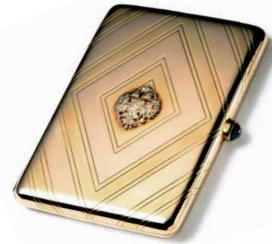
卡地亚俄罗斯1912年烟盒