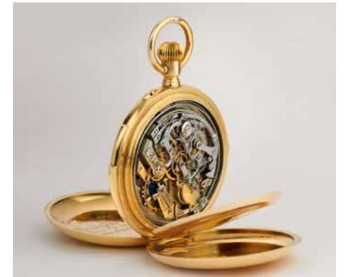
亨利慕时 Zarenadler 帝王雄鹰古董怀表，在品牌的现代表款中也可以看到带有这种雄鹰造型的腕表。

其有关的有趣表款。因为我们计划回到俄罗斯，此前只是买回品牌，而没有进入市场。在一些俄国博物馆的图片资料中，随处可见亨利慕时的身影。所以那里的人们知道亨利慕时、记得亨利慕时，他们的爸爸可能戴着亨利慕时的表。这些都是我们拥有的市场潜力。”可以看到，一个与俄罗斯有着独特情缘的品牌会被它深深地牵动，从历史中一路走来遗留下的印记也历经沉淀，成为亨利慕时除了制表技艺以外最珍贵的内在。