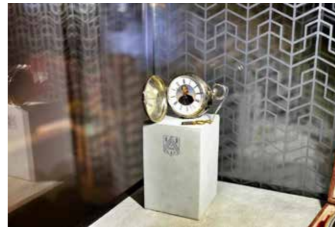
Vladimir Lazo 中尉的怀表

直径 48 毫米，厚度 14 毫米，银表壳，珐琅表盘，防水 50 米/手动上链机芯/时分秒显示