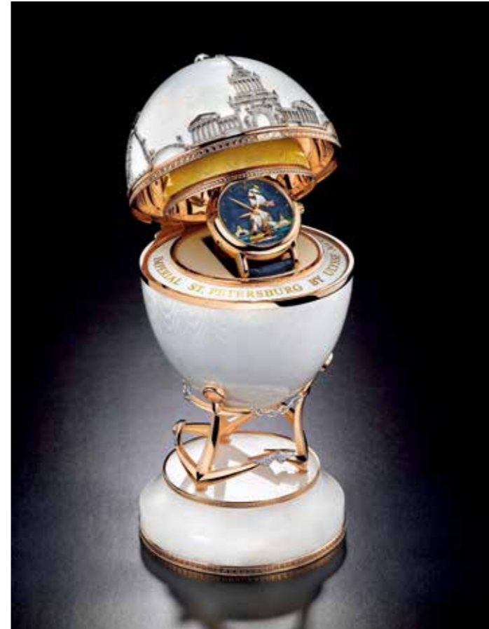
“萨丹进击号”沙皇蛋壳雕限量纪念彩绘套表

直径40毫米，珐琅表盘，防水50米/自动上链机芯，振频每小时28,800次，直径25.6毫米，厚度3.6毫米，动力储存42小时，天文台认证/时分秒显示/限量30枚