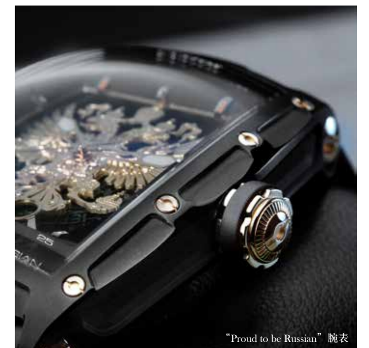
“Proud to be Russian” 腕表