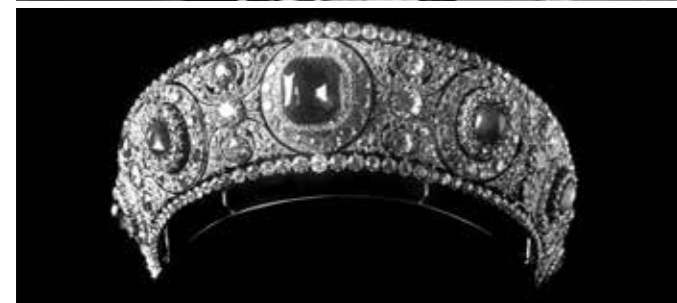
欧嘉帕雷公主(1865-1929年)在1907年卡地亚圣彼得堡欧洲大酒店的展览为卡地亚精美的作品所深深着迷 (上) 1908年出品的Kokoshnik皇冠，镶有7颗蓝宝石，为弗拉迪米尔大公爵夫人定制款。