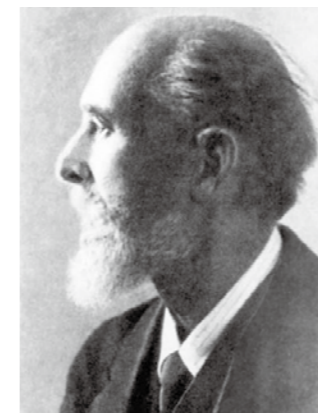
俄国金匠、珠宝首饰设计师法贝热。他制作的复活节彩蛋促使卡地亚在珐琅工艺上做更深入的探索，并与其展开竞争。

去年卡地亚在上海举办了“瞬息·永恒——时间艺术展” (Cartier Time Art)，规模之大展品之多引起不俗反响。展览特别开辟了俄罗斯单元，展示了众多俄国元素作品，追溯了卡地亚兄弟与俄罗斯的渊源。这个国家以自己的特性深深吸引了卡地亚，极大地丰富了品牌的作品风格和创作维度。这些历史甚至超越璀璨的珠宝，因为它无法定价、千金难买、能且只能被恒久典藏。